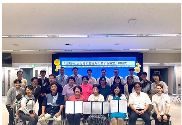
「宇和島市・名古屋市と災害時相互協力協定締結」