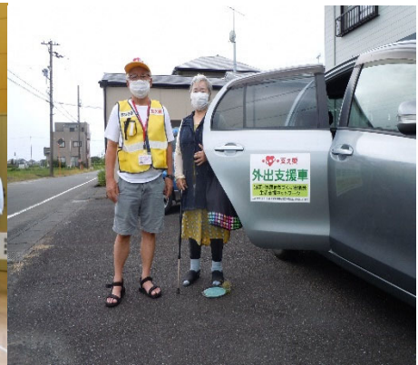
「マイカーによる外出付き添い支援」