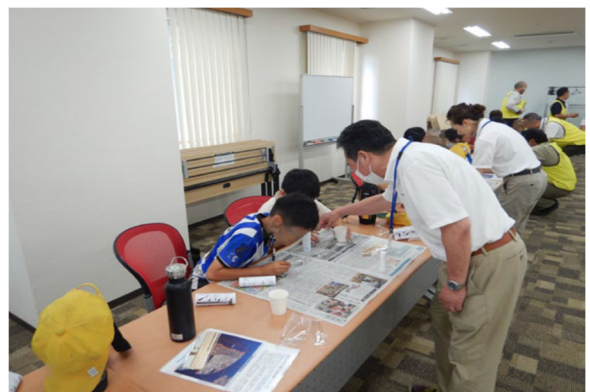
子どもたちへの環境学習「海ごみを使用した環境」