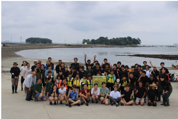
「アマモボランティア参加者の集合写真」

活動内容：佐久島の海の環境を守りたいという生徒の思いから 2002 年に総合的な学習の時間から始まったアマモの保全活動。近年減ってきているといわれているアマモ場を、年間を通して学校、地域、行政が「アマモ場を守り、活動によって豊かな海にしていく」という目的のために行っている。