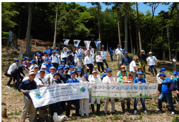
地元の協力で「豊かな伊勢湾の海を未来につなげていく活動」海につながる森づくり編

活動内容：伊勢湾に対する理解を深めると共に、市民が伊勢湾と接するための健全な活動を支援するための事業を行い、美しく豊かな伊勢湾と活力ある「みなとまち」づくりの実現、次世代を担う子供や海域環境保全と親海・親水の啓発など、公益への貢献に寄与する活動を行っている。