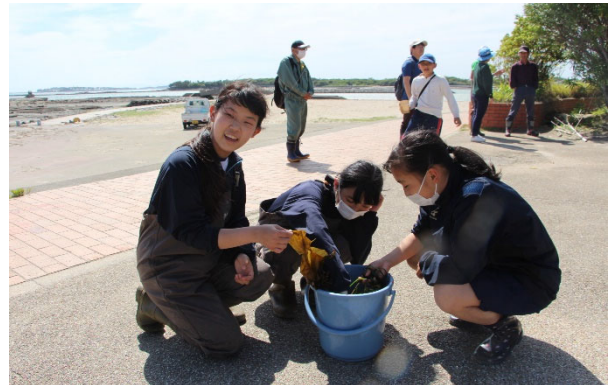
「アマモを移植する子どもたち」