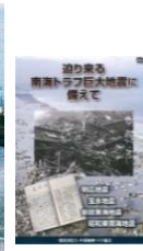
【DVD】追り来る南海トラフ巨大地震に備えて