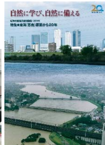
【地震豪雨等災害記録】 自然に学び、自然に備える