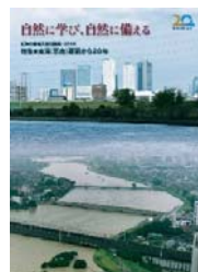
【地震豪雨等災害記録】自然に学び、自然に備える