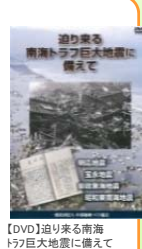
【DVD】迫り来る南海トラフ巨大地震に備えて