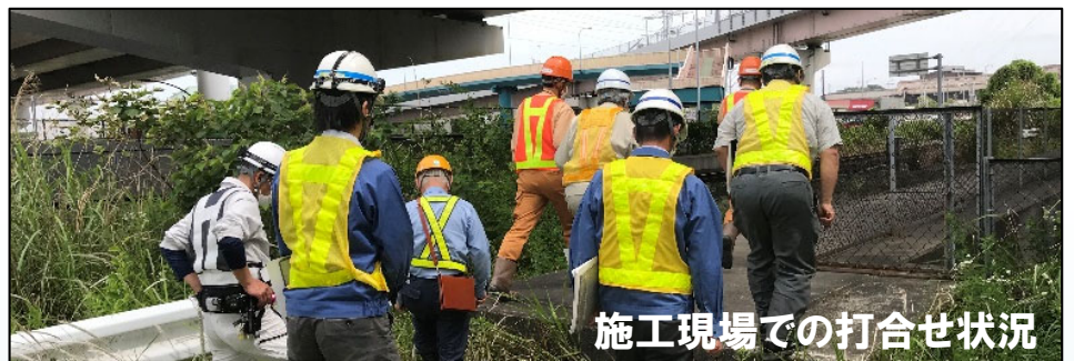
施工現場での打合せ状況

本業務は、西知多道路の愛知国道施工区間（愛知県東海市新宝町～荒尾町）における対外協議、調整等を円滑かつ適正に遂行することを目的として実施するものです。